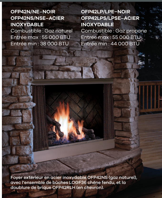
Foyer extérieur en acier inoxydable OFP42NS (gaz naturel), avec l'ensemble de bûches LOGF36 chêne fendu, et la doublure de brique OFP42RLH (en chevron).

Combustible : Gaz propane Entrée max : 55 000 BTU Entrée min : 44 000 BTU