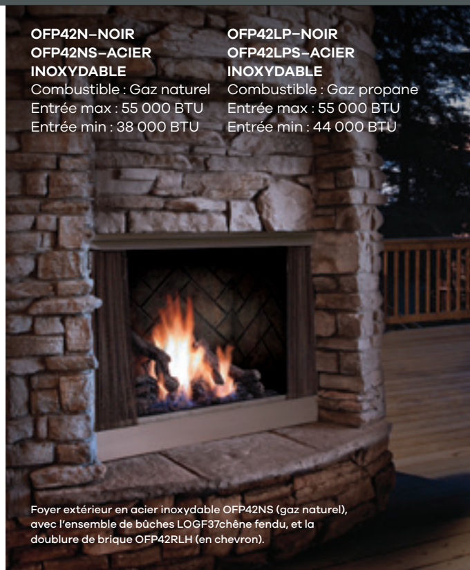
Foyer extérieur en acier inoxydable OFP42NS (gaz naturel), avec l'ensemble de bûches LOGF37chêne fendu, et la doublure de brique OFP42RLH (en chevron).

OFP42LP-NOIR OFP42LPS-ACIER INOXYDABLE Combustible : Gaz propane Entrée max : 55 000 BTU Entrée min : 44 000 BTU